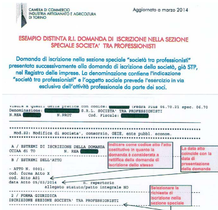
Figura 2: Esempio di compilazione Mod. S2 tratto dal sito R.I.-Torino

Si raccomanda , stante la specifica procedura di iscrizione seguita dal Registro delle Imprese di Torino, di indicare come inattiva la STP fino al momento in cui verrà richiesta , al medesimo Registro, l'annotazione dell'avvenuta iscrizione nella sezione speciale dell'Albo professionale .