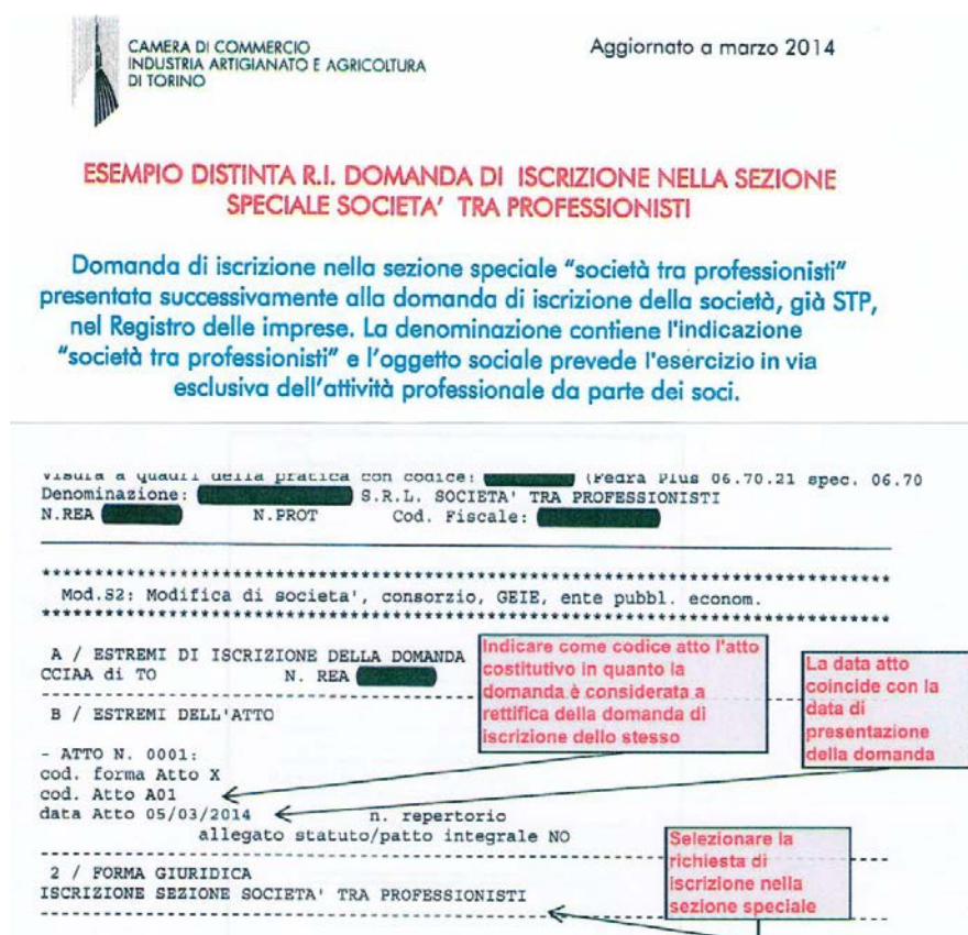
Figura 2: Esempio di compilazione Mod. S2 tratto dal sito R.I.-Torino

Si raccomanda , stante la specifica procedura di iscrizione seguita dal Registro delle Imprese di Torino, di indicare come inattiva la STP fino al momento in cui verrà richiesta , al medesimo Registro, l'annotazione dell'avvenuta iscrizione nella sezione speciale dell'Albo professionale.